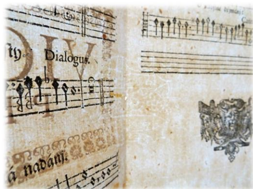
vodoznak užitého papíru