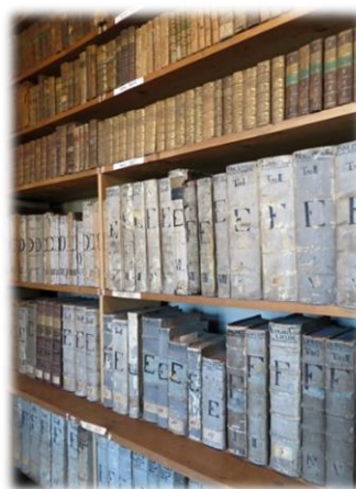
Část františkánské knihovny ve Vlastivědném muzeu ve Slaném