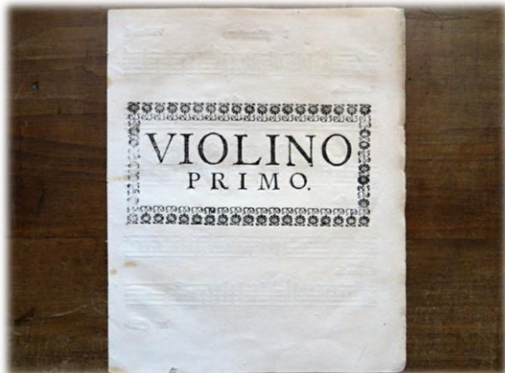
Titulní list nalezeného hlasu prvních houslí

Adam Václav Michna z Otradovic (1600-1676) byl český raně barokní básník, sbormistr a skladatel, jehož tvorba byla soustředěna především na duchovní hudbu. Ačkoli byl skladatelem velmi plodným, mnoho jeho děl se do dnešní doby nedochovalo. To už dnes ovšem neplatí o jednom z autorových nejznámějších cyklů – Loutně české.