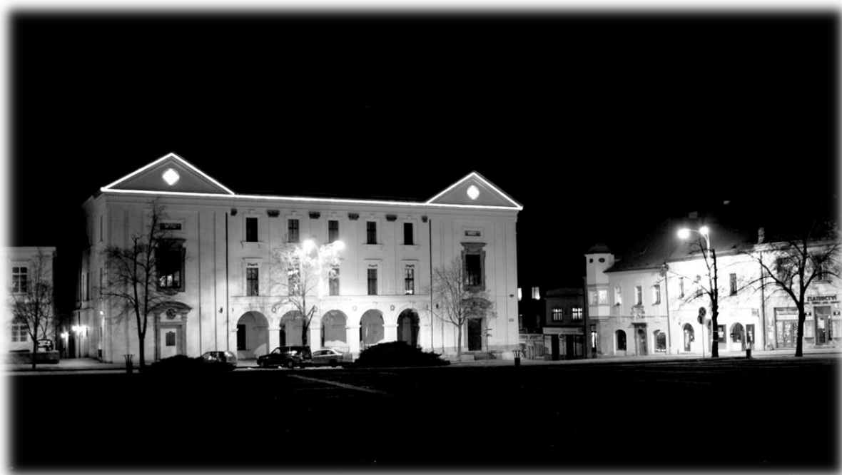
Předvánoční muzeum

v měsíci lednu je jako každým rokem muzeum návštěvníkům do jisté míry uzavřeno. Je to především čas zhodnocování dosavadní práce a příprav na nadcházející sezónu. Poslední loňské výstavy jsou již rozebrány, pokud se však budete chtít podívat na stálé expozice či vědecky bádát, rádi Vás uvítáme, podobně jako na první letošní besedě.