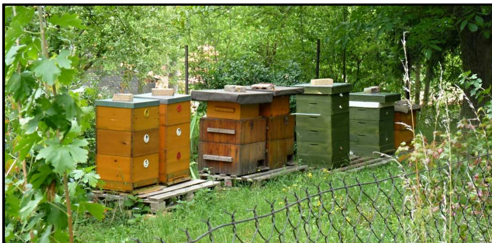
Soudobé včelí úly (Blevice u Zákolan)

připravovanou kreativní soutěž pro doprovodným programem V průběhu měsíce října si totiž vnučata přijít vyzkoušet postavit Nebudou vyžadovány kamenické a stavět z kostek stavebnice Lego! stavebnice Lego přineseme příště.