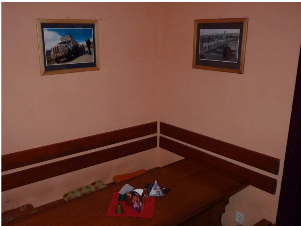
Pohled do slánské Kavárny – Vinárny Na Komendě s fotografiemi z Kurdistanu.