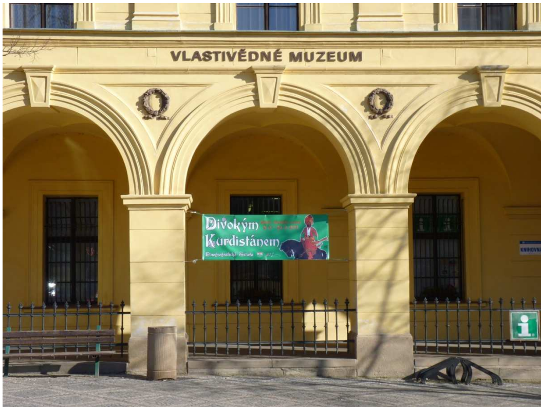
Vydejte se s námi Divokým Kurdistanem!