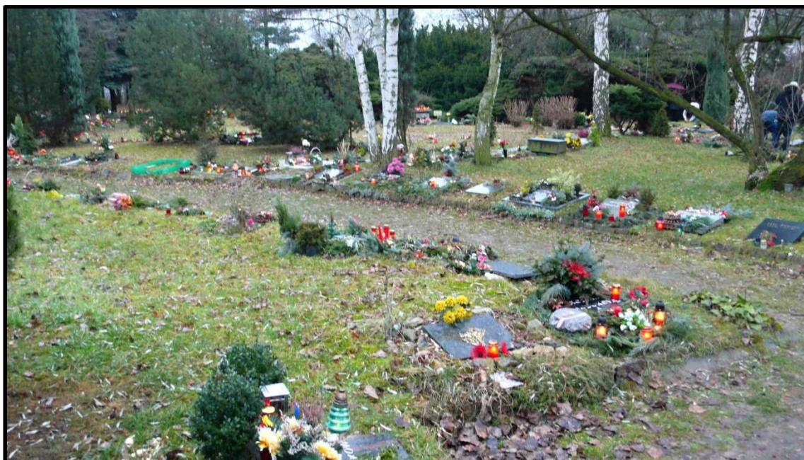
Urnový háj slánského hřbitova o Štědrý den.