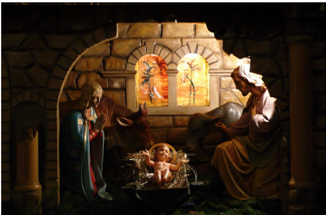
Jesličky v půvabném betlémě kostela sv. Gotharda ve Slaném.