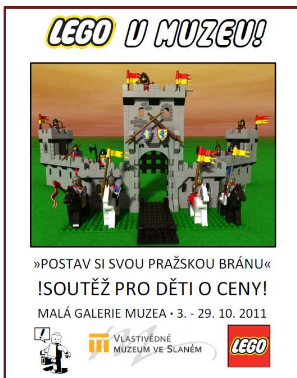
Plakát k soutěži