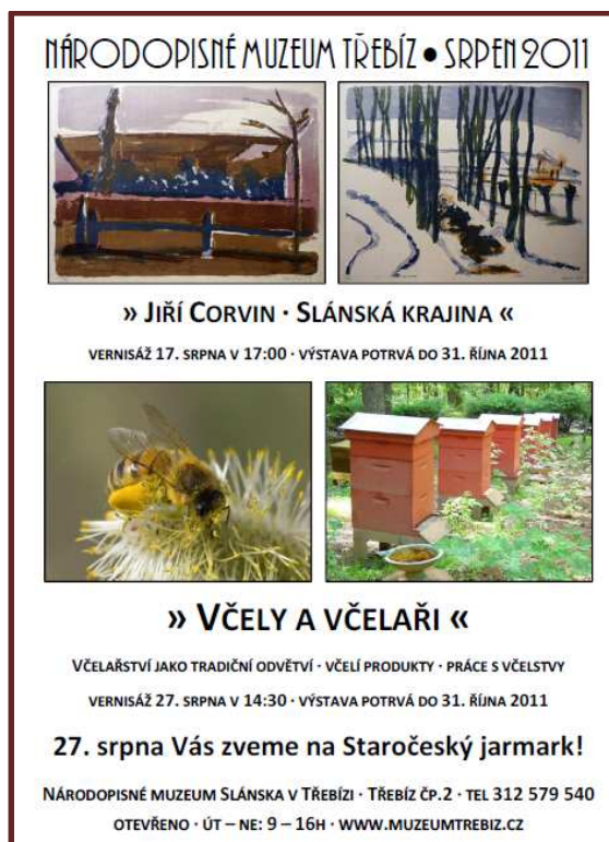
Jiný příklad plakátu