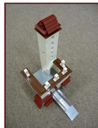
Soutěž pro děti „Postav si svou Pražskou bránu“ a jeden z modelů (LEGO)