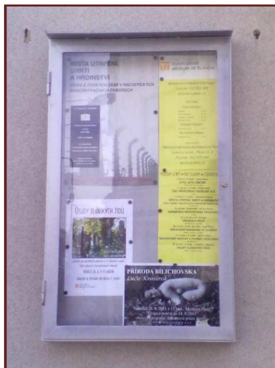
Nová nástěnka muzea (Česká spořitelna)